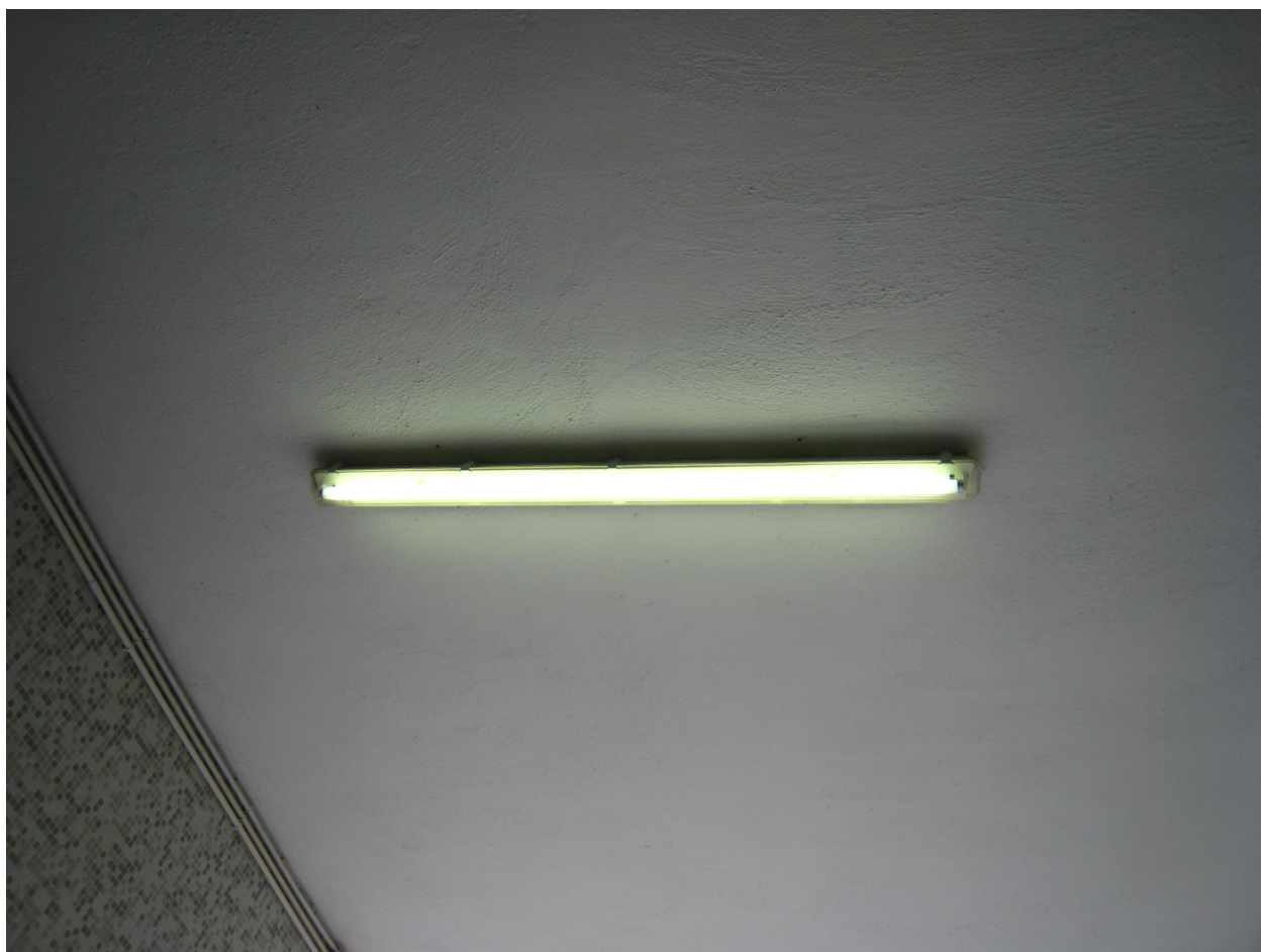
工程前有蓋操場 T8 光管。