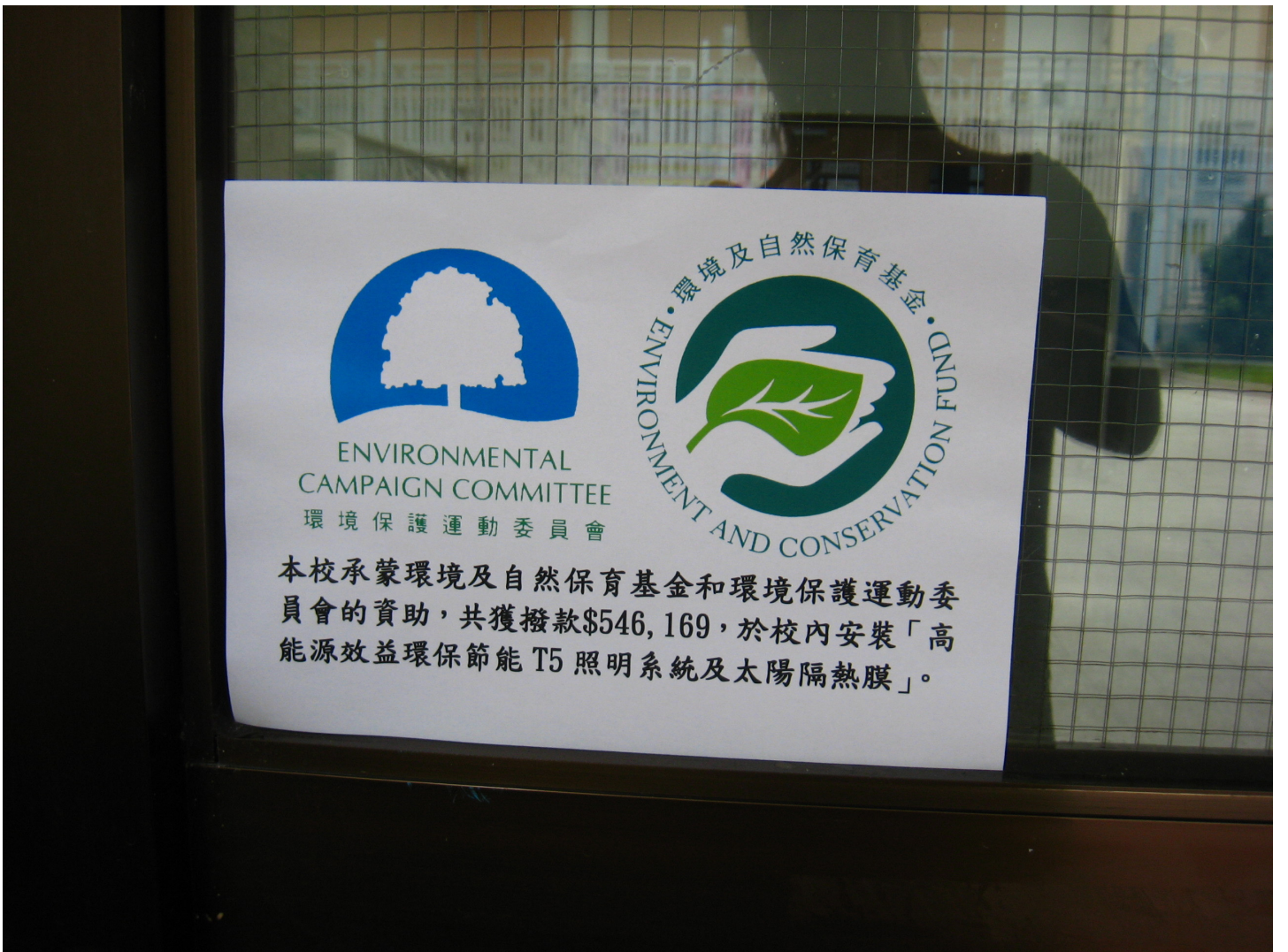
鳴謝資料已張貼於學校正門。