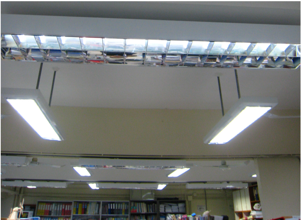
教員室 T5 節能光管。