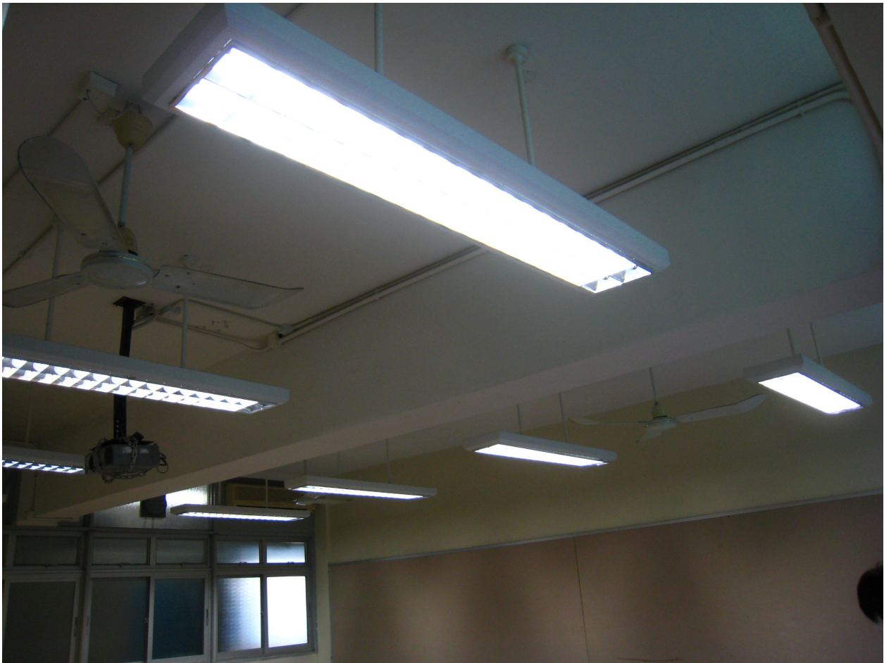
工程後課室的 T5 光管(光管較幼身，並改用白光。)