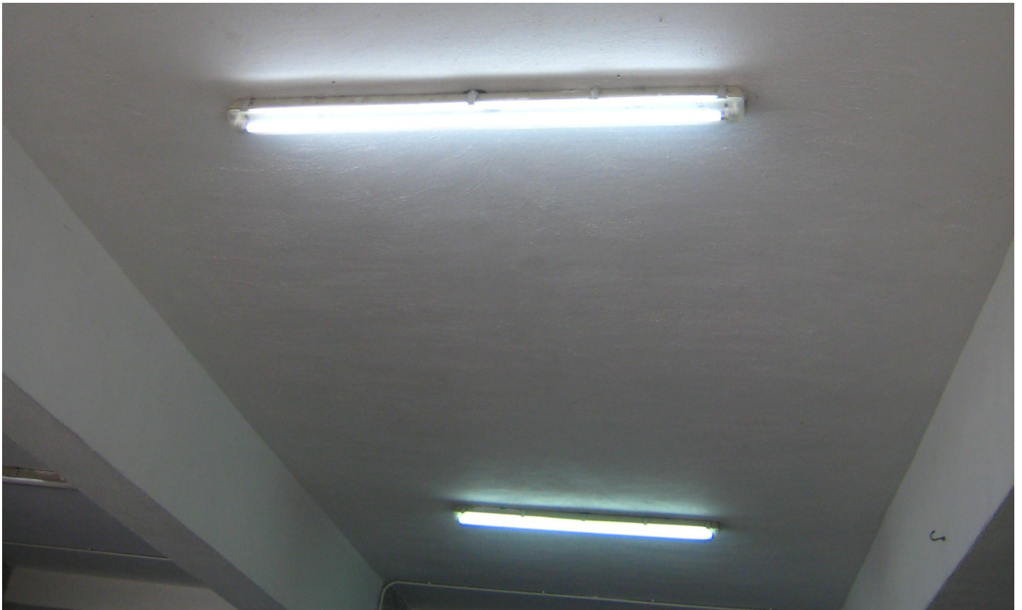
有蓋操場 T5 節能光管。