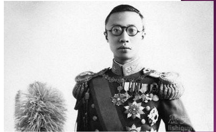
清朝末代皇帝溥儀

◎2016年10月，海防博物館舉辦末代皇帝溥儀展覽，展出他在囚蘇聯時寫的藝術合體字，包括「招財進寶」、「天下太平」等。