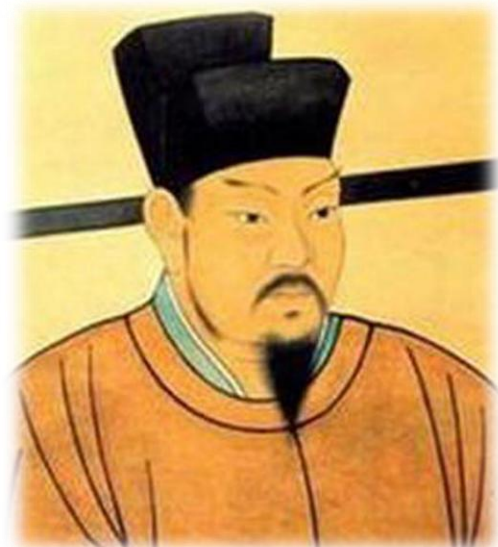
北宋文學家王安石